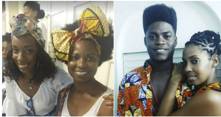
Activistas afrodescendientes cubanos.